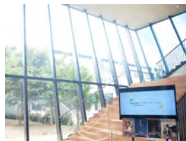
ステップの流れをビデオで説明