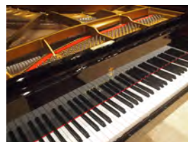
昨年の流山ステップより スタインウェイピアノD274