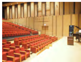
感染対策を徹底したホール