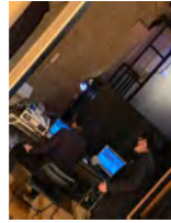
レコーディングエンジニアさん