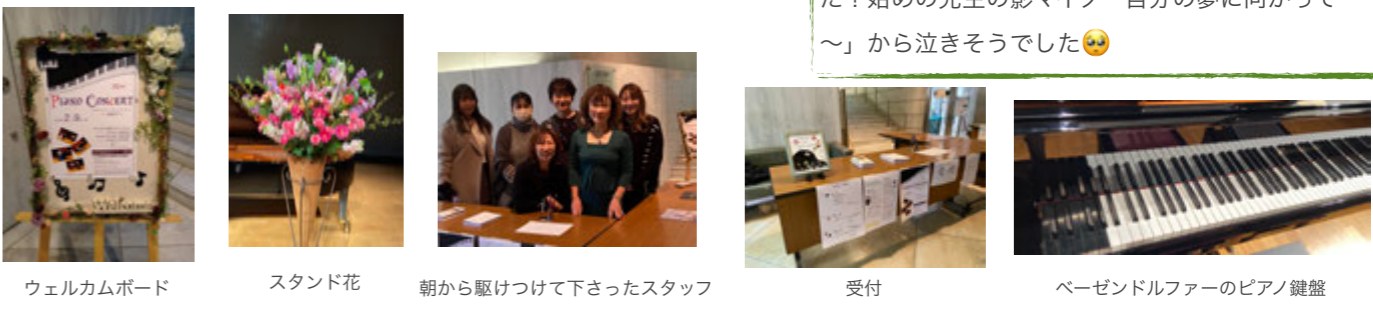
ウェルカムボード スタンド花 朝から駆けつけて下さったスタッフ 受付 ベーゼンドルファーのピアノ鍵盤

先生、昨日は素敵な発表会をありがとうございました!始めの先生の影マイク「自分の夢に向かって～」から泣きそうでした!